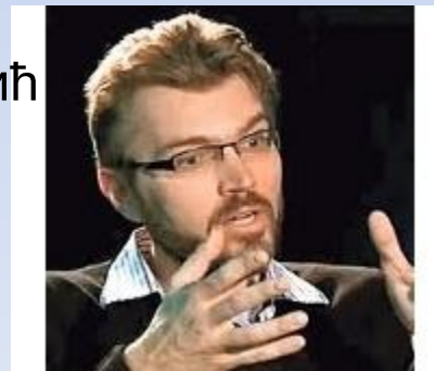
2010 - Влатко Ведрал, теорија квантне информације